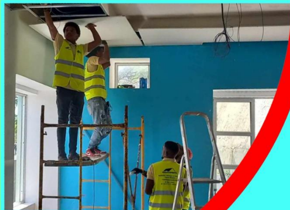
'Ons' kantoor in Renovatie São Filipe bibliotheek